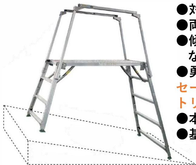
【傾斜地使用イメージ】