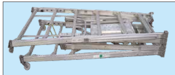
組立時でも 移動に便利なキャスター付 コンパクトに折りたたみ収納