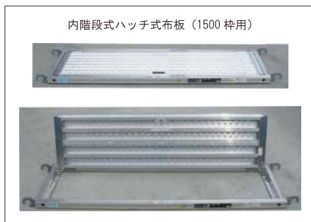
【1500 枠・内階段式ローリングタワー資材】