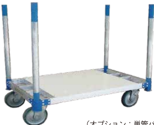
（オプション：単管パイプ）