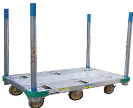
(オプション：単管パイプ)