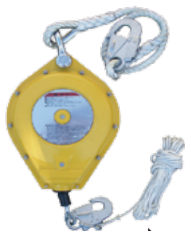
引き寄せロープ (販売品)